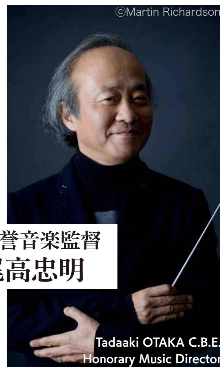
名誉音楽監督 尾高忠明