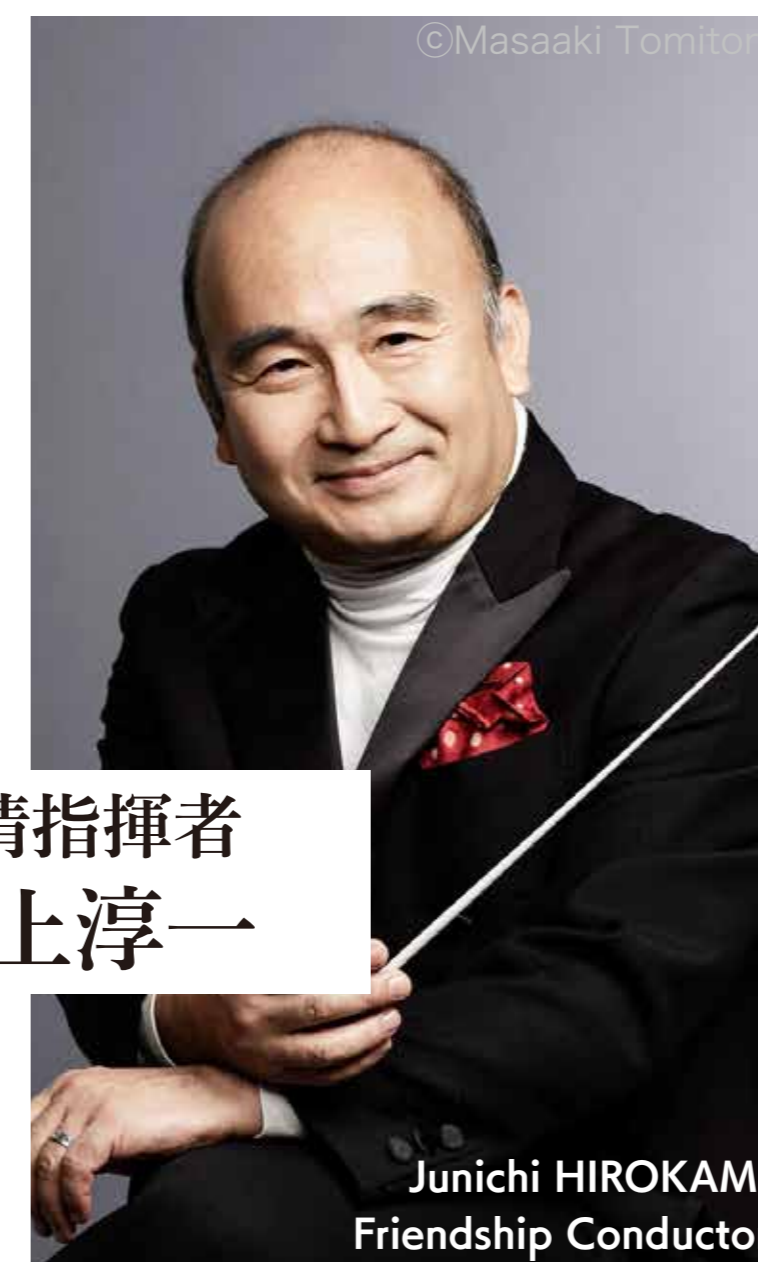
友情指揮者 広上淳一