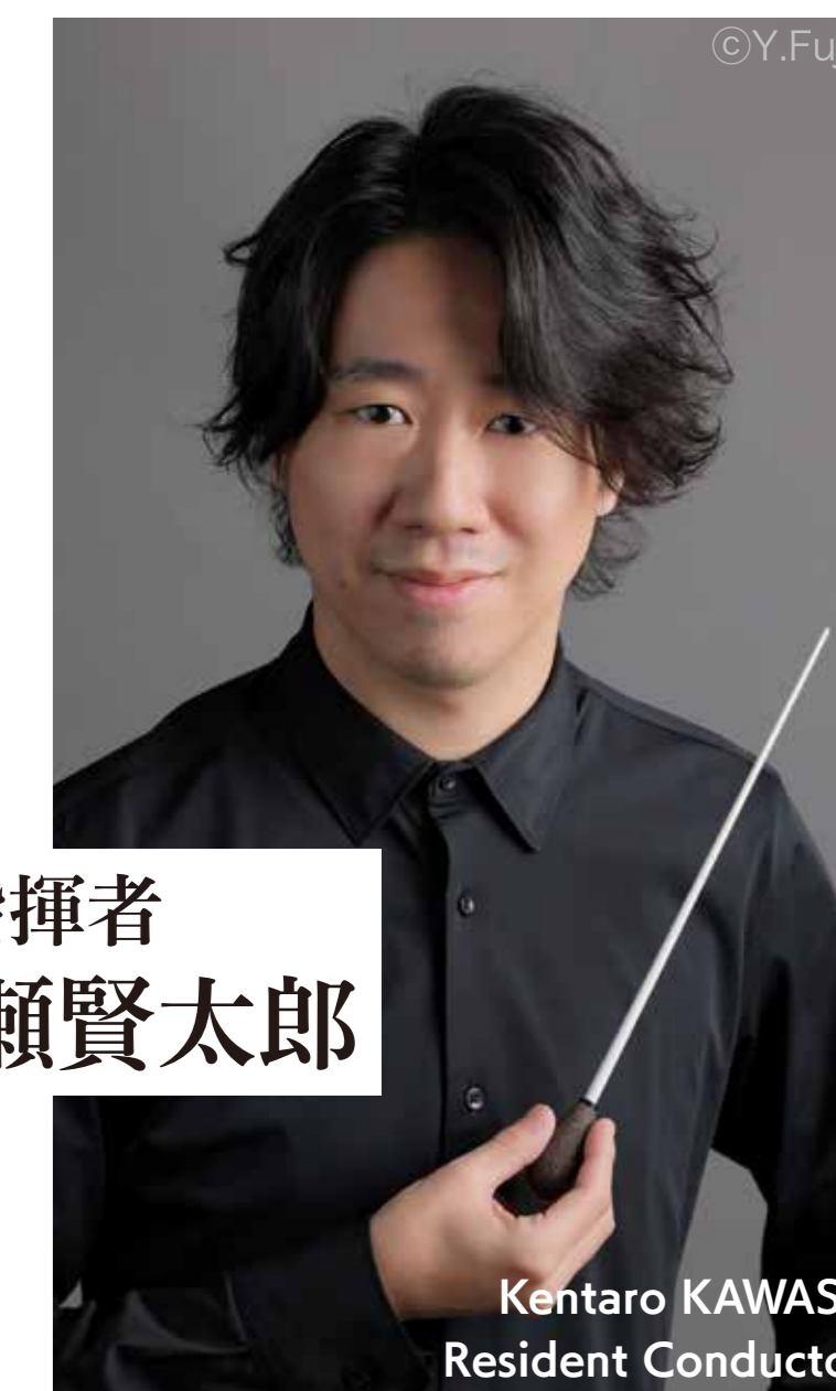
正指揮者 川瀬賢太郎