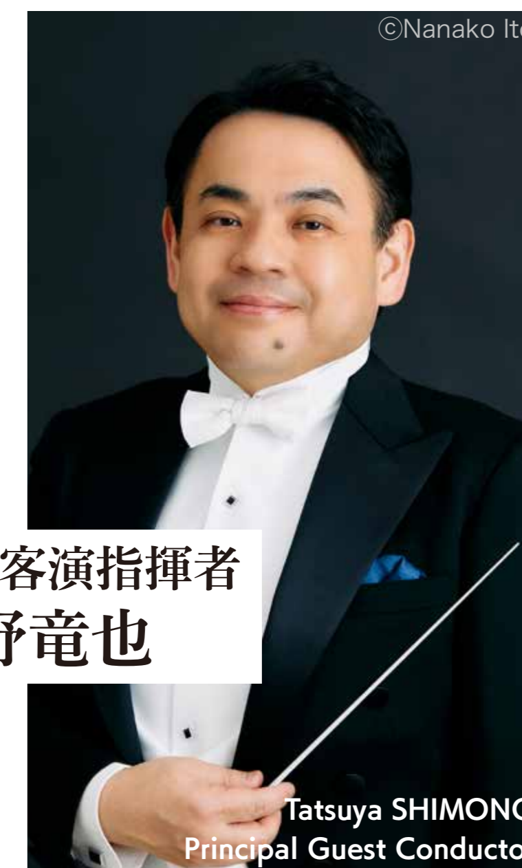
首席客演指揮者 下野竜也